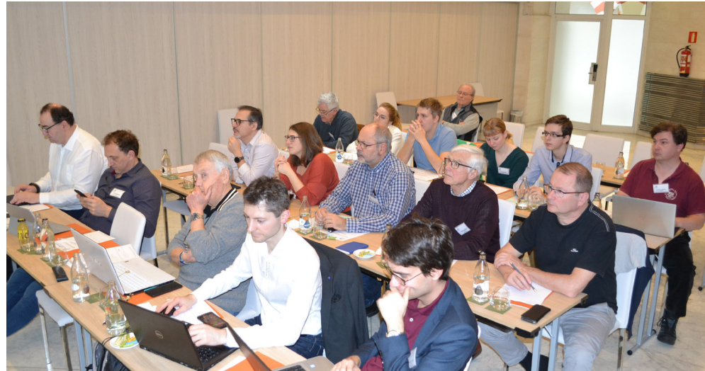
Réunion du Conseil National A&I