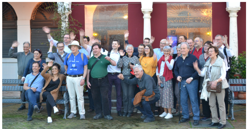
Visite de Carmona

historique de la ville, un des endroits les plus envoûtants de Séville. Des dédales de rues enchanteresses et tortueuses, des balcons fleuris, des maisons authentiques, des places innombrables où se côtoient des cathédrales, des minarets et des pa-