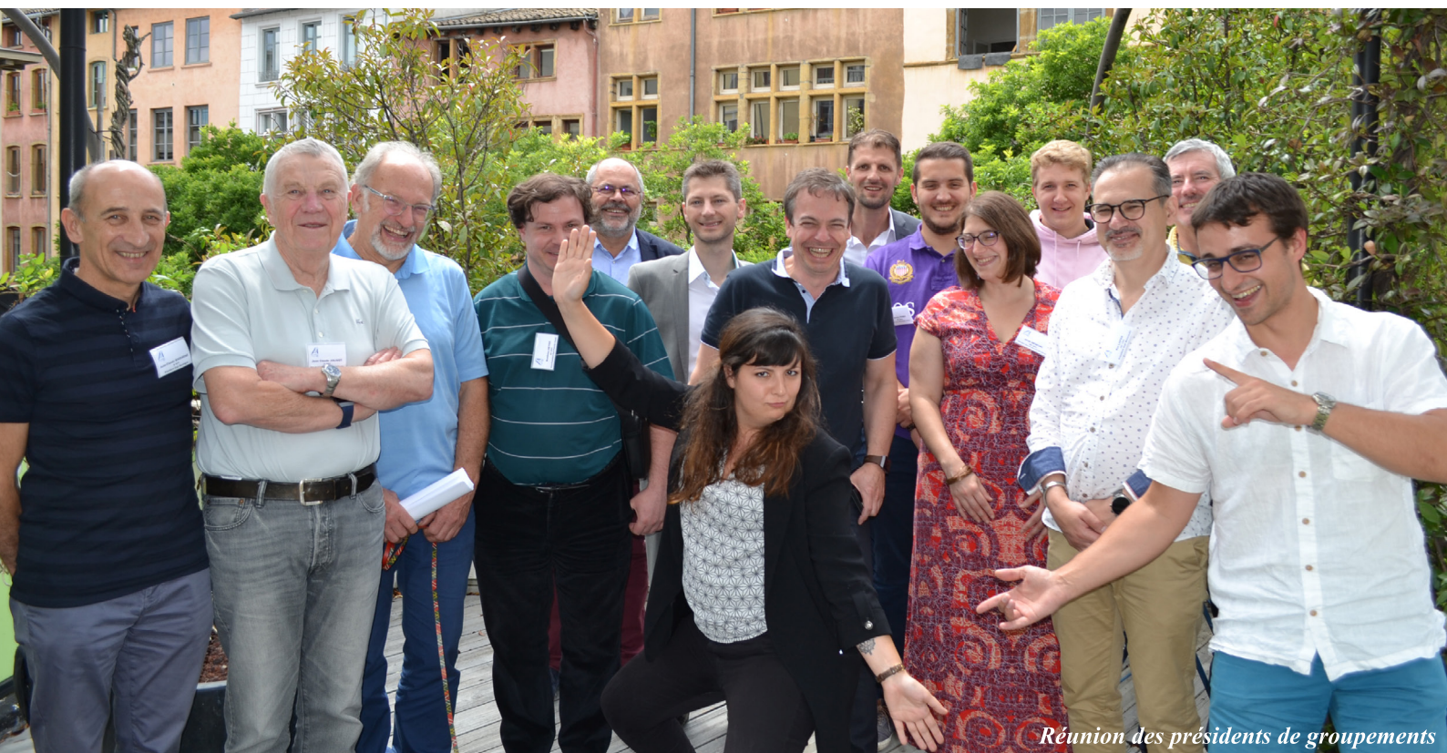
Réunion des présidents de groupements

Nous remercions chaleureusement les participants pour leur contribution à cette édition 2019 de la réunion des présidents de groupements !