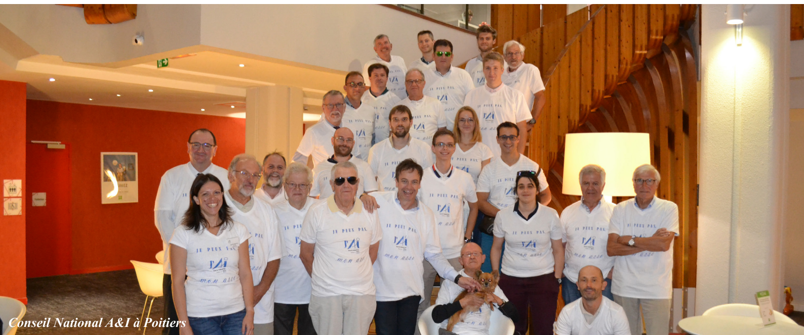
Conseil National A&I à Poitiers

Tous ont un rôle essentiel qui représente un des maillons de notre réseau. Mais certains, voulant s'impliquer et construire l'avenir d'Arts & Industries, endossent le rôle de conseiller national.