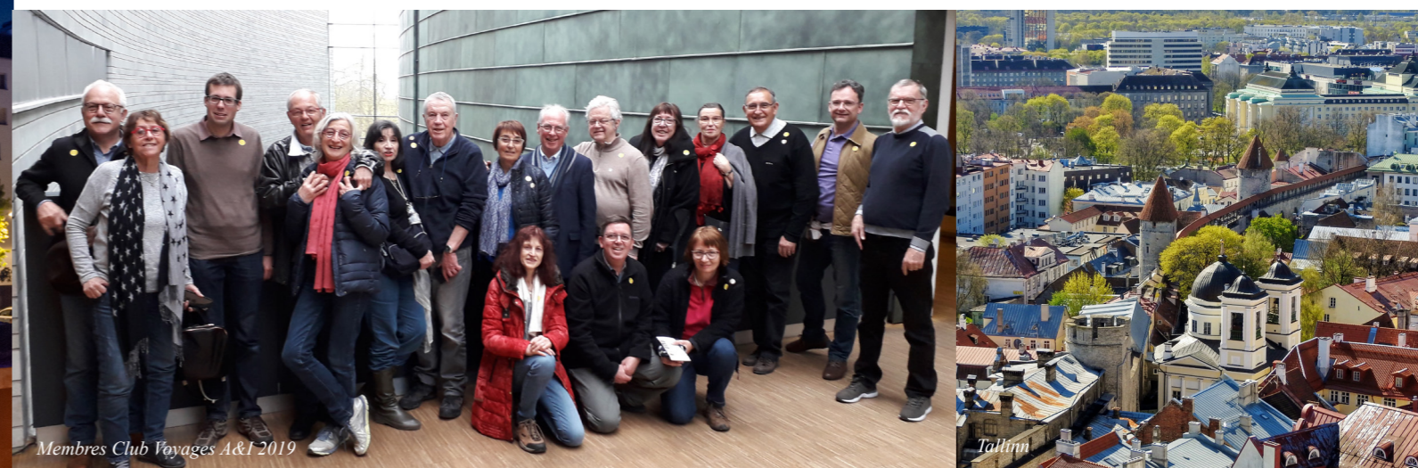
Membres Club Voyages A&I 2019

Les participants ont énormément apprécié ce voyage et attendent avec impatience le prochain grand départ en 2020 !