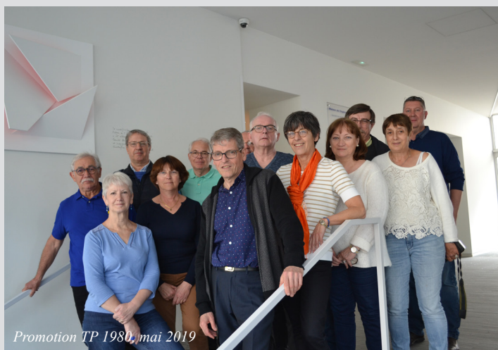
Promotion TP 1980, mai 2019