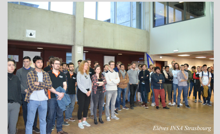
Elèves INSA Strasbourg