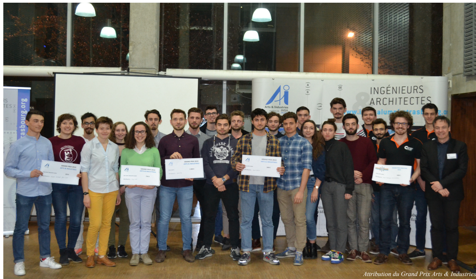
Attribution du Grand Prix Arts & Industries

A l'issue de cette cérémonie conviviale, un verre de l'amitié a été offert à tous les participants par Arts & Industries.