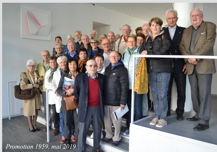
Promotion 1959, mai 2019