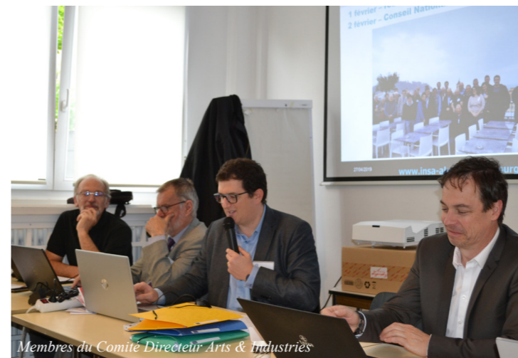
Membres du Comité Directeur Arts & Industries

Un grand merci à l'ensemble des participants pour leur présence lors de ce week-end !