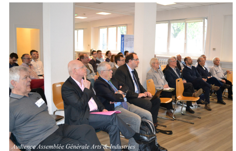
Audience Assemblée Générale Arts & Industries